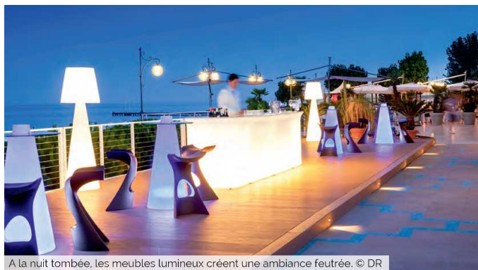
À la nuit tombée, les meubles lumineux créent une ambiance feutrée.

Pour faire impression, auprès des participants, leur quantité variera selon le style de la soirée organisée. Un mange-debout, par exemple, idéal pour des apéritifs, peut rassembler jusqu'à cinq personnes et se percevoir comme des satellites du comptoir. Deux ou trois permettent déjà d'instaurer une certaine ambiance. Lors d'événements plus posés, les «cubo» peuvent faire office de tables basses, à portée de main de personnes assises sur une banquette type snake. En termes de saisonnalité, les meubles lumineux sont aussi bien utilisés en hiver que l'été. «Comme ils sont apparents dans l'obscurité, les meubles ne feront toutefois effet qu'une fois la nuit tombée», met en garde Lidiana D'Addona. Leur volume en fait des meubles vite encombrants, plus intéressants à louer ponctuellement. Le